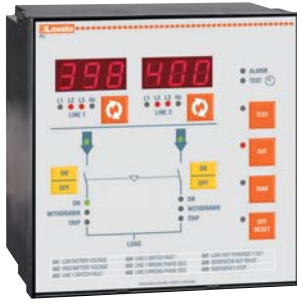
ATL20 A240 ATL30 A240